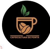
Cafeicultura de ponta

Clique acima nas fotos e conheça o perfil dos nossos influencers!